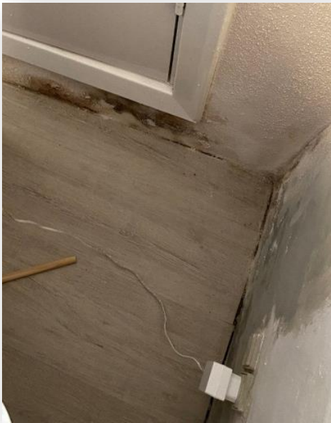
Det kunne tyde på at fugten trækker op fra gulvet?