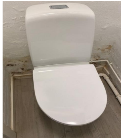
Et toilet, med omgivelser som ikke lige er det bedste