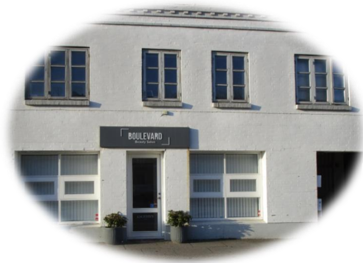
Aaboulevarden 93 Horsens

Vi kan blot meddele de berørte parter, at vi ikke kan hjælpe med ret meget, og kan kun råde til at få flyttet og komme væk fra et sådan lejemål.